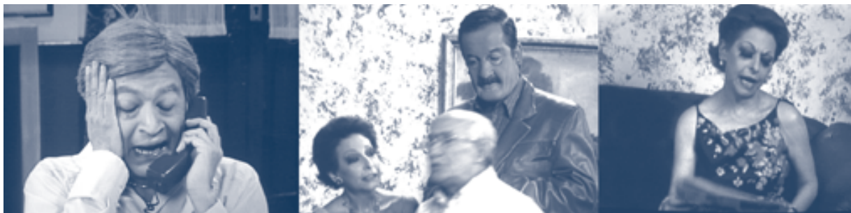
Durante la transmisión del programa El privilegio de mandar, XEWTV.