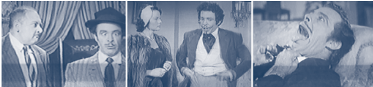
Germán Valdés, Tin Tan, en Chucho el remendado , 1951.

Por su lado, la infracción en materia de derechos de autor que se puede invocar por la explotación no autorizada de una obra derivada, es la prevista en la fracción XIV del artículo 229 de la LFDA (entre dichas infracciones se encuentran “Las demás que se deriven de la interpretación de la presente Ley y su Reglamento”), en relación con los artículos 78 y 21, fracción III, del mismo ordenamiento jurídico, los cuales establecen: