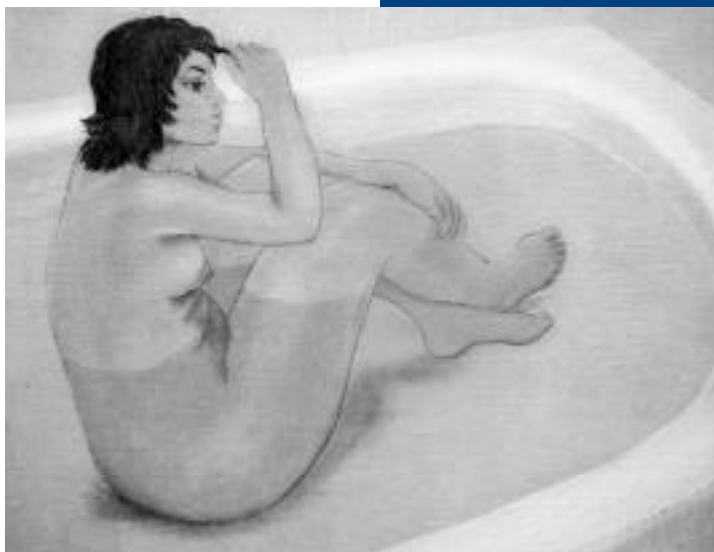
Mario Reyes, Mientras medita , aguafuerte y aguainta, 2004.

NO ME GUSTA HACER RETRATOS PORQUE TENGO QUE PINTAR A LA PERSONA COMO ELLA QUIERE. ESO NO ME DA LIBERTAD. DEBO SER MUY SINCERO. OLVIDAR SI LO QUE HAGO QUEDARÁ BONITO O FEO, SI SE VENDERÁ O NO. LO IMPORTANTE ES VOLCAR TODO LO QUE SIENTO, Y SI SALE ALGO DIGNO, QUE SE APROXIME A COMO QUIERO, QUÉ BIEN.