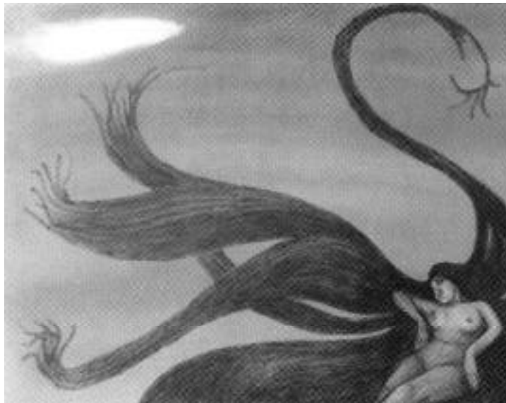
Mario Reyes, El sueño del cisne, intaglio, s/f.

—Nunca creí que fuera a llegar hasta aquí.