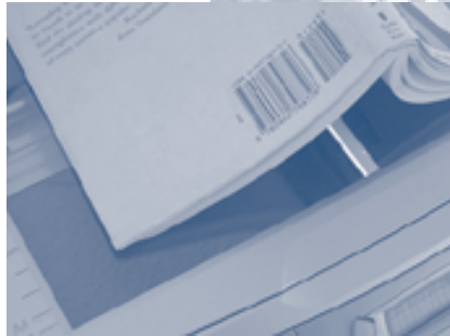
Coedición del Instituto de Biología y Plaza y Valdés, 1999.

Mientras tanto, de acuerdo con un cable de la agencia EFE, el comité de creación de una biblioteca digital en Europa se reunió en Francia, donde el ministro de cultura de ese país informó que la pausa en el escaneo de Google no modifica en nada el proyecto de digitalización amplia y organizada de obras del patrimonio europeo, aunque sí muestra la necesidad de diálogo entre editores y titulares de derechos de autor para construir una biblioteca digital que respete los derechos de propiedad intelectual