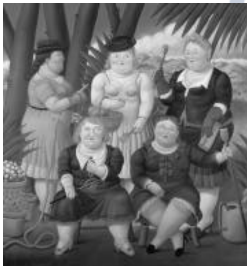
Remedios Varo, Locomoción capilar, 1959.

El pintor se quejó por las reproducciones que se comercializan en Estados Unidos, pues aunque el museo cedió los derechos a Publix, esta firma no tenía facultades para cederlos a Art Brokers. La comercializadora, por su parte, aduce que adquirió de buena fe los derechos y está dispuesta a llegar a un arreglo extrajudicial ■