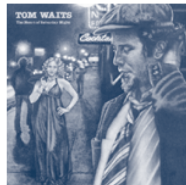
The Hearth of Saturday Night, 1974. Electra / Asylum Records.

El cantante, furioso, los demandó legalmente en Alemania –donde se realizaron los comerciales–, y afirmó que aunque para algunos artistas “lo ideal es aparecer desnudo ronroneando en la capota de un coche, he rechazado este dudoso honor terminante y repetidamente”. Ahora pide una compensación económica, además de las ganancias generadas por los anuncios. (Con base en información de AFP publicada en diversos diarios.) ◀