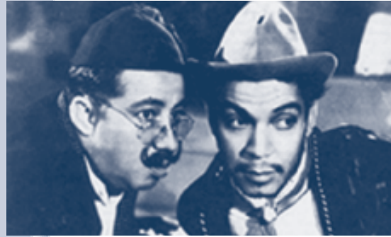
Ahí está el detalle, 1940.