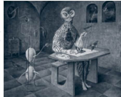
Remedios Varo, La creación de las aves, 1957. Catálogo razonado, Ed. Era.

Tal sentencia provocó la indignación entre intelectuales, expertos en derechos de autor, representantes de sociedades autorales, profesores de la Facultad de Derecho de la UNAM, críticos de arte y expropietarios de algunos de los cuadros de la pintora, quienes coincidieron al señalar que la extensa documentación presentada por el INBA a modo de prueba –testimonios notariales que acreditan que las obras fueron vendidas o regaladas por la autora a terceras personas, documentos de compraventa, cartas de petición y pólizas de seguros que amparan préstamos para exposiciones– no fue valorada en su verdadera dimensión y alcance jurídico