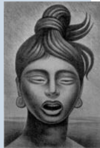
La ceiba, 1957.

Al final, murió en su tierra, como él quería ■